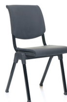
HÅG Conventio 9510