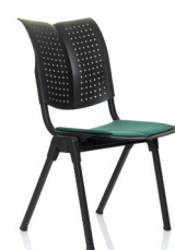
HÅG Conventio Wing 9821