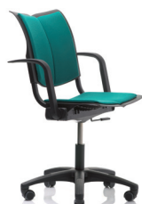
HÅG Conventio Wing 9832 Armlehnen (optional)