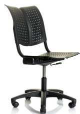
HÅG Conventio Wing 9812