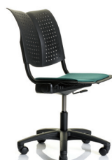
HÅG Conventio Wing 9822