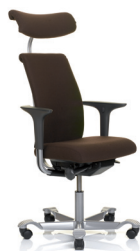
HÅG H05 5500 optional mit Kopfstütze