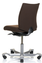
HÅG H05 5200