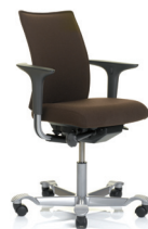
HÅG H05 5400