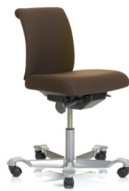
HÅG H05 5100