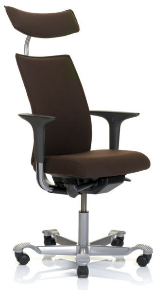
HÅG H05 5600 optional mit Kopfstütze