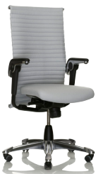
HÅG H09 Excellence 9320 Optional mit Fußkreuz aus poliertem Aluminium Vadal Uni 111