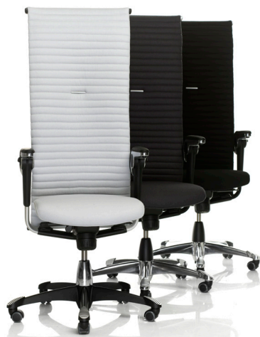
HÅG H09 Excellence 9330 Vadal Uni 111 (Hellgrau), 171 (Dunkelgrau) und 191 (Schwarz)