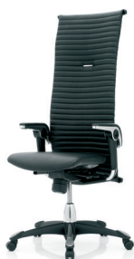
HÅG H09 Excellence 9330 Elmosoft 99999