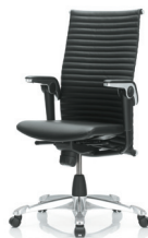
HÅG H09 Excellence 9320 Optional mit Fußkreuz aus poliertem Aluminium Elmosoft 99999