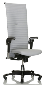
HÅG H09 Excellence 9330 Vadal Uni 111